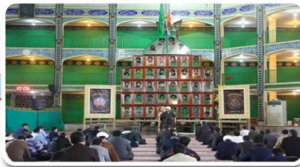
حجت الاسلام مهدوی نژاد ۱۴۰۰/۰۹/۰۶

- مسئولین در طول سالیان گذشته شیوه های قانونی و مدنی بیان اعتراض و انتقاد و مطالبه گری را به مردم یاد ندادند. - واقعا مردم چگونه اعتراض، انتقاد و مطالبه شان را بیان کنند؟ یا باید پای صندوق رای بیایند یا کف خیابان. - باید راه های اعتراض و مطالبه گری را واقعا برای مردم باز کنند. یکی از راهها این است که خود مسئولین در مساجد محلات بنشینند و به مردم پاسخ بدهند. اجازه ندهند اعتراض ها به کف خیابان کشیده شود و دشمن سوء استفاده کند. - مردم حق مطالبه گری دارند، اما نباید کاری کنیم که دشمن سوء استفاده کند و مردم را مقابل نظام نشان بدهد. کسانی که به اسم مطالبه گری یا به دنبال حق و حقوق مردم هستند زود پیشنهاد تجمع ندهند. بسیاری از تجمعات جواب نمی دهد، حتی نتیجه عکس می دهد و بحران تولید می کند. باید گروه های مختلف اجتماعی بروند با مسئولین منطقی حرف بزنند.